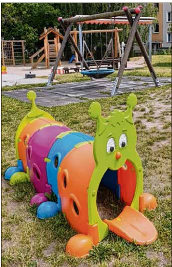
Diese bunte Kletterraupe wurde aus der Kita „Spatzennest“ gestohlen.

„Um die Kinder etwas zu beruhigen, haben wir ihnen erzählt, dass aus der Raupe ein Schmetterling geworden ist“, erzählt Manuela Klimm.